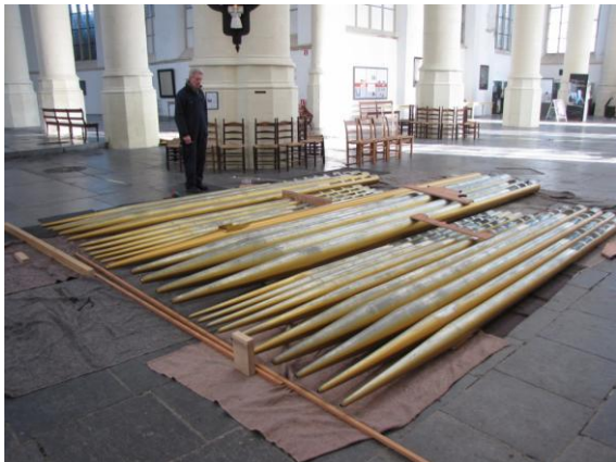
Deze pijpen worden morgen geplaatst