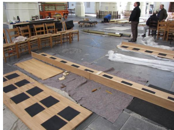
... de linkerzijkant volgt nog