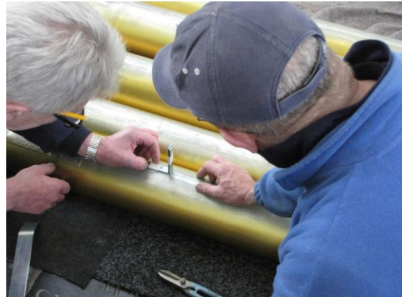
Maar eerst is precisiewerk nodig