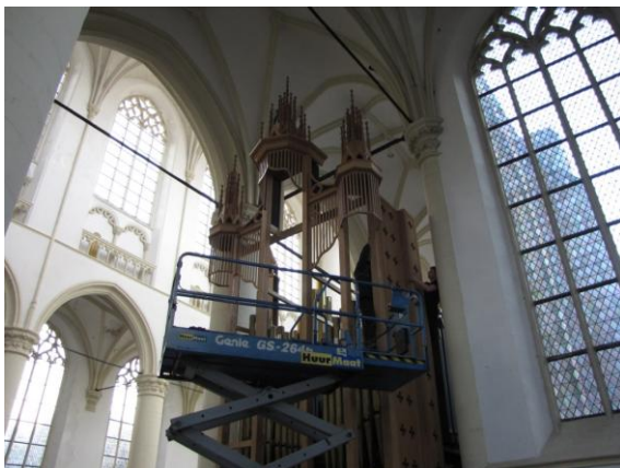
Hier wordt de rechterzijkant geplaatst...