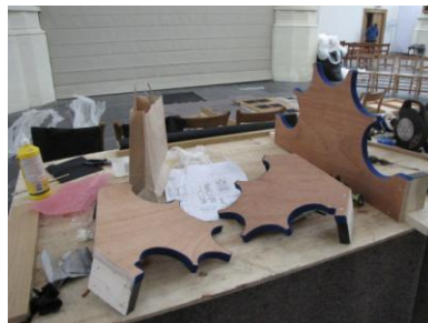
Delen van het front