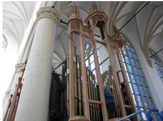
...en dit is vandaag!