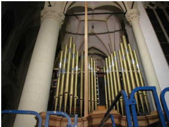
Dit was eergisteren...