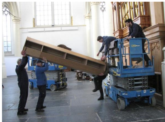
De tweede toren van het westfront gaat omhoog...