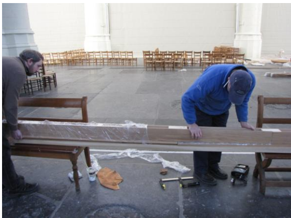
... t.b.v. het zuidfront