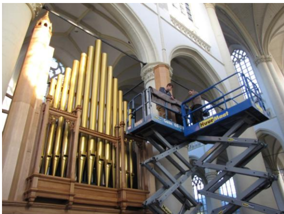
... en staat bijna op zijn plaats