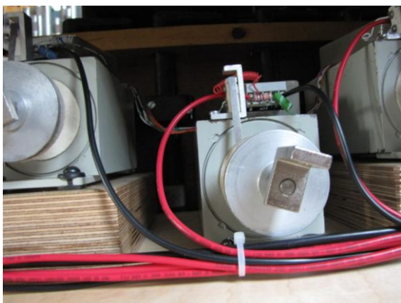
Meters bedrading worden aangebracht