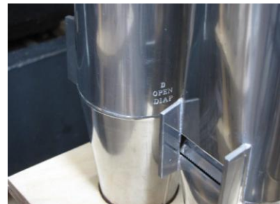
Double Open Diapason inscriptie

U kunt nog steeds orgelpijpen adopteren / doneren: stuur een email aan info@cathedralorgan.nl !