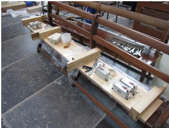
De motoren die de pedaalregisters bedienen