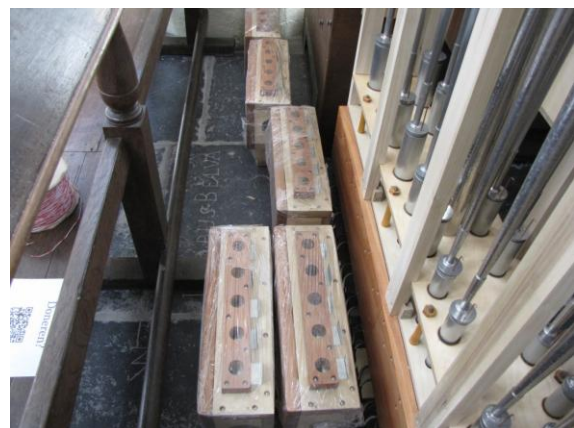
Hierop komt een deel van de Violone 16'