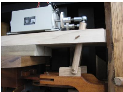
Verbinding motor - registertrekker