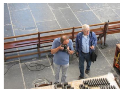
Nog een fotograaf...

U kunt nog steeds orgelpijpen adopteren / doneren: stuur een email aan info@cathedralorgan.nl !