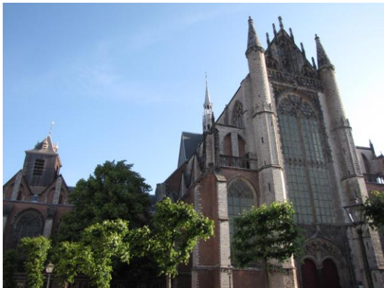
De Hooglandse Kerk in de ochtendzon