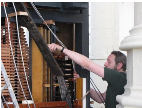
..Mark ook ten behoeve van de Trombone 16'