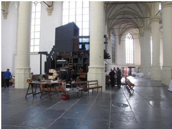
Dag 5: men is weer vroeg begonnen