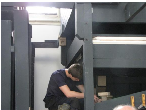
De laatste windkanalen worden aangebracht