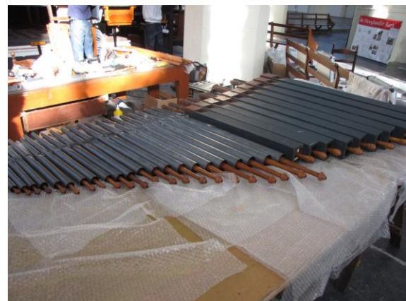
Diverse (gedekte) pijpen van het Swell liggen klaar