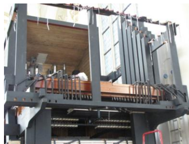
Conducten van de Open Diapason I