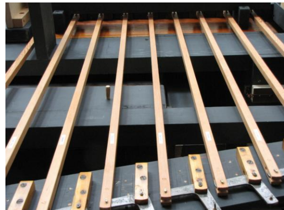
Hier de registermechaniek van het Swell