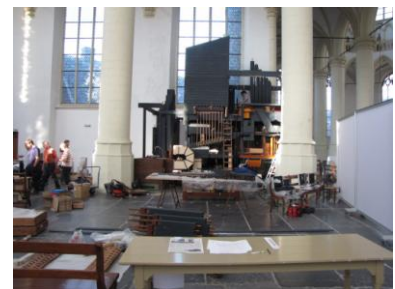
Zo, morgen weer een dag...

U kunt nog steeds orgelpijpen adopteren / doneren: stuur een email aan info@cathedralorgan.nl !